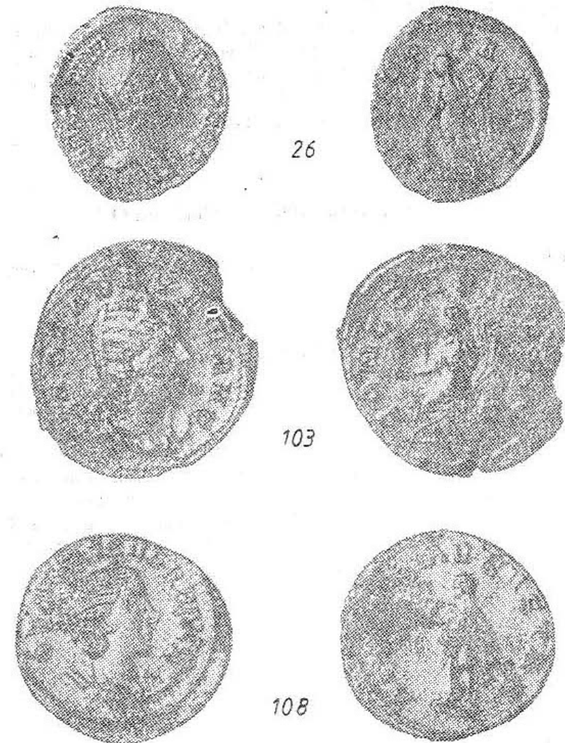
Fig. 4. Monede de la Severus Alexander (nr. 26) și Otacilla Severa (nr. 103 și 108); mărimea 2/1.

În ceea ce privește greutatea denarilor (fig. 2), predomină piesele sub 3 g, care adesea — deși sînt bine conservate — prezintă margini tăiate (emisiuni de la Clodius Albinus, Septimius Severus) sau creștături marginale 8 , dînd impresia de monede crăpate în cursul procesului de batere. Majoritatea pieselor sînt circulare, tocite și nu întîlnim nici un exemplar „fleur de coin”.