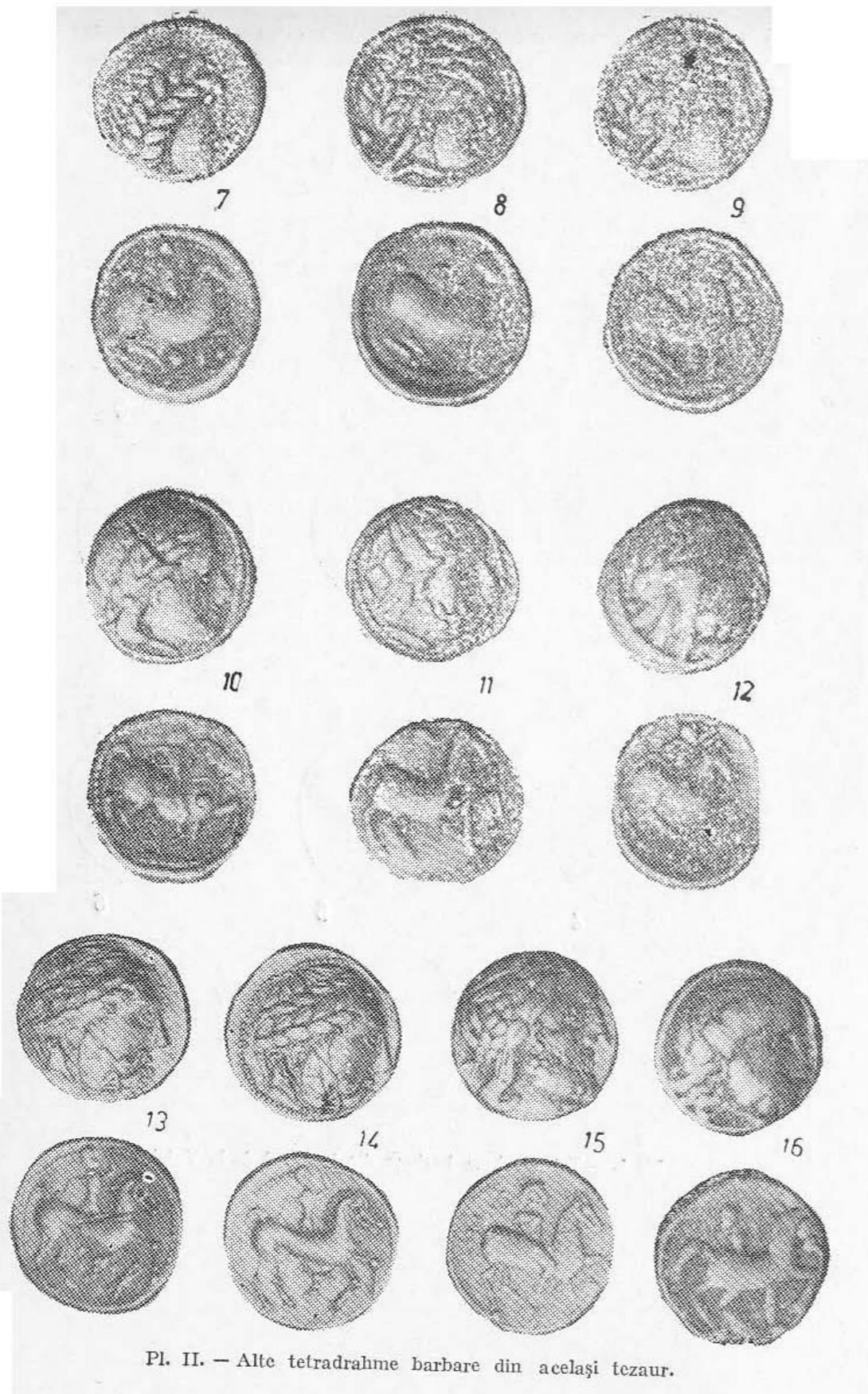
Pl. II. — Alte tetradrahme barbare din același tezaur.

Rîmnicu Vilcea ori de câte ori afla cite ceva nou în acest domeniu de preocupări comune.