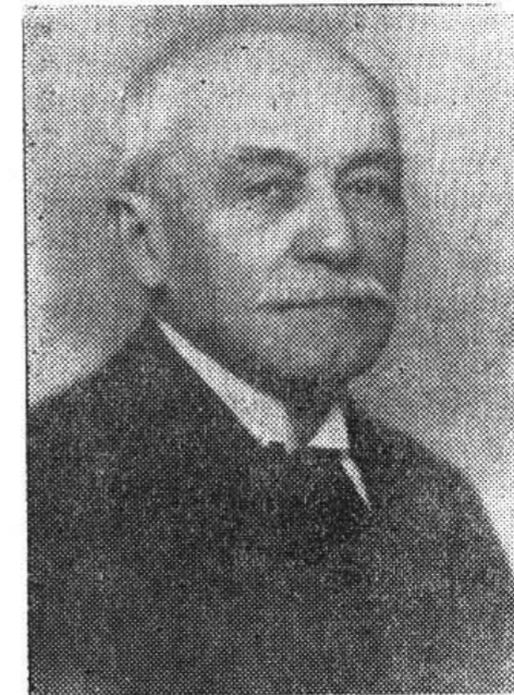
ELIE DEM. MIREA *

Fig. 2. Ornaments et formes graphiques remarquables sur les monnaies ottomanes en cuivre des XIV e — XVI e siècles: 2 av. et rv.; 5, 6 et 7 av.; 4 rv.