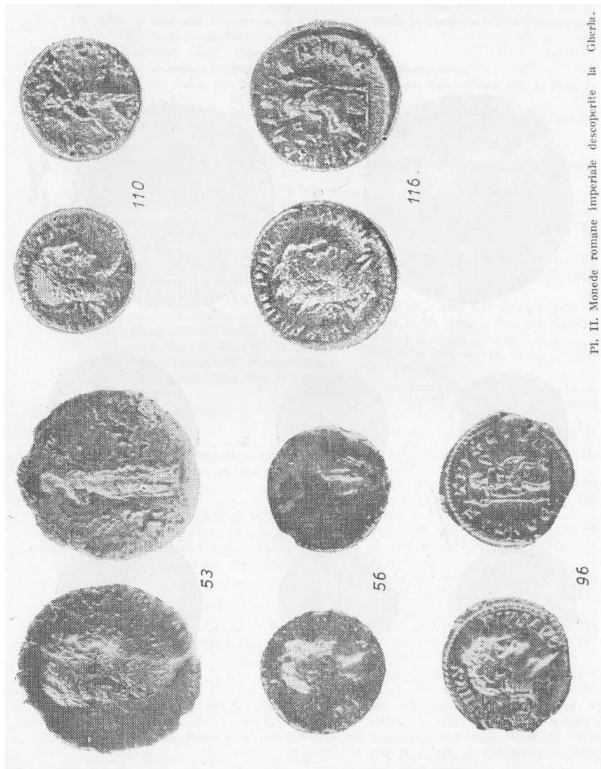
Pl. II. Monede romane imperiale descoperite la Gherla.