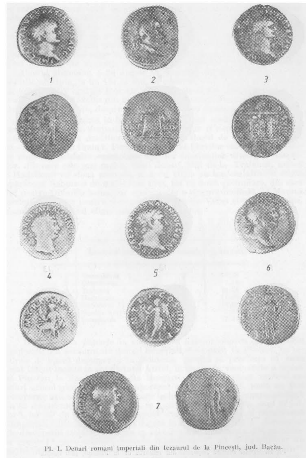
Pl. I. Denari romani imperiali din tezaurul de la Pîncești, jud. Bacîu.