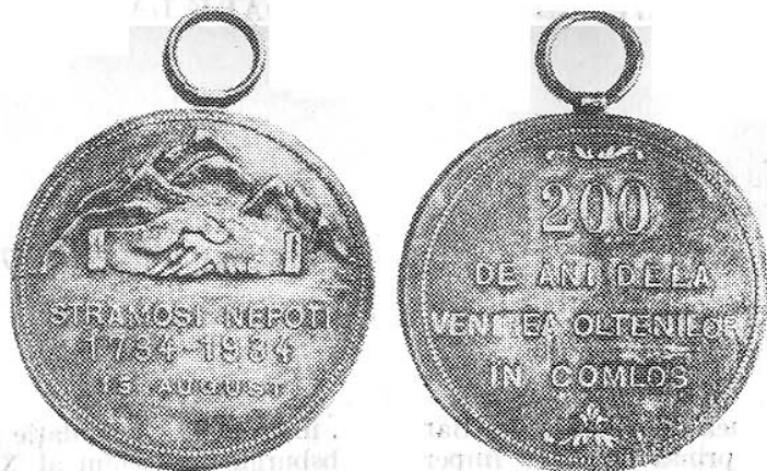
Fig. 1. Medalia „200 de ani de la venirea oltenilor în Comloș”.

Fig. 2. Le diplôme commémoratif „200 ans de l'arrivée des Olténiens à Comloș”.